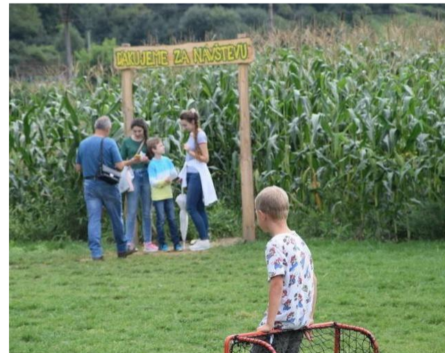
► Bludisko v kukuričnom poli.